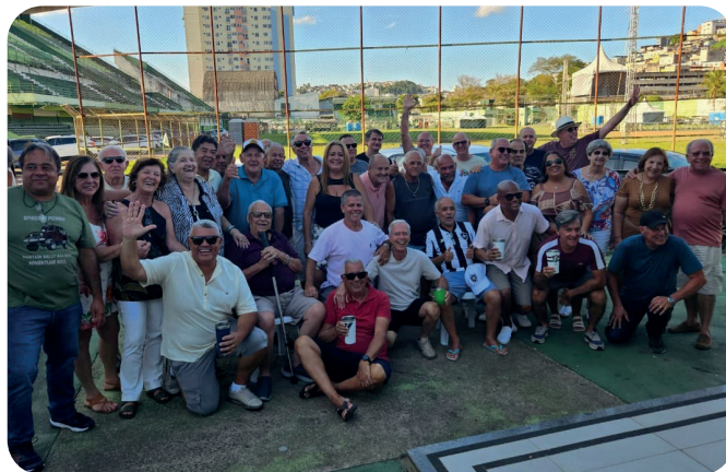
Juiz de Fora